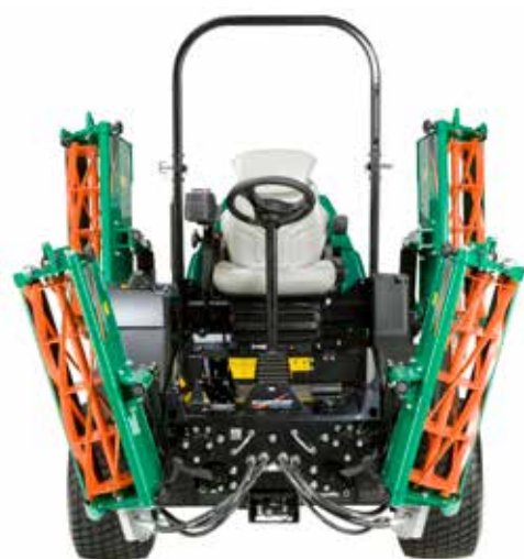
Transportbreedte: 1,89 meter

De kooien worden direct aangedreven hetgeen zorgt voor een hoge betrouwbaarheid, lagere kosten en superieure maaikwaliteit onder alle omstandigheden. De zijkooien kunnen tot 150 mm achterwaarts wegklappen bij het raken van obstakels. Een breekbout kan schade voorkomen wanneer dit niet voldoende is. Door de plaatsing van de middenkooi achter de vooras is eenvoudig onderhoud en stabiliteit tijdens transport gegarandeerd.