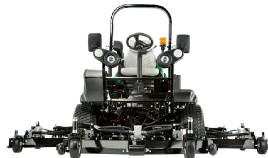
Maaibreedte: 3,30, 3,50 of 4,30 meter