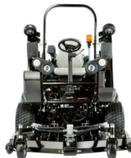
Transportbreedte: 1,65 meter