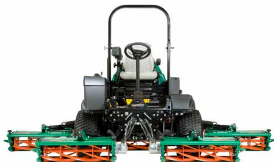
Maaibreedte: 3,50 meter